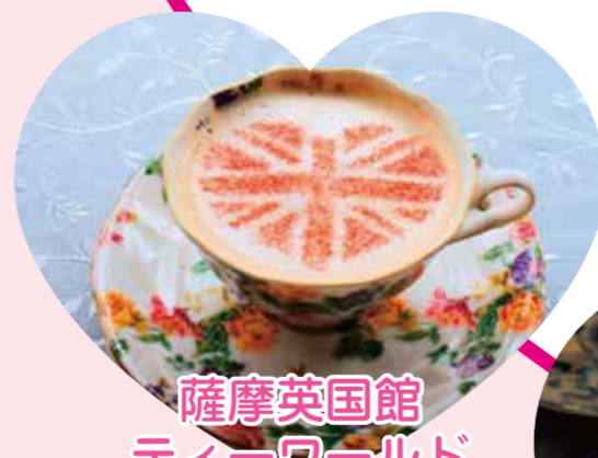
薩摩英国館 ティーワールド