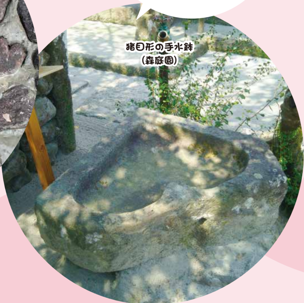
猪目形の手水鉢 (森庭園)