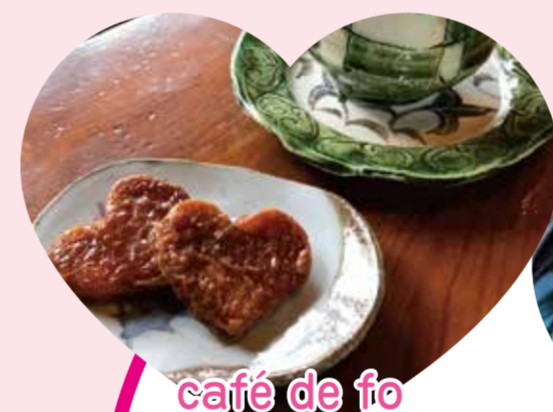
café de fo